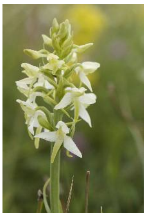
Platanthère à deux fleurs