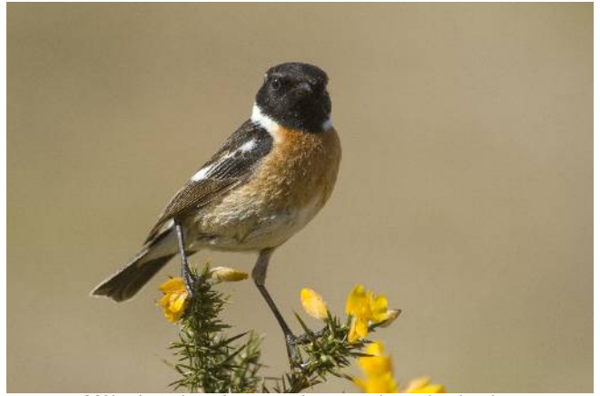
Mâle de tarier pâre, un oiseau typique des landes

Le site est toujours fréquenté par les oiseaux d'eau que sont