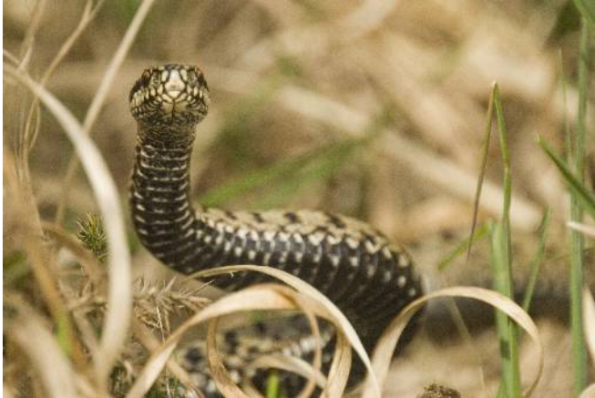
Mâle de vipère péliade

Un changement du mode de calcul des dotations aux Réserves Naturelles Nationales par le Ministère en charge de l'environnement a permis de doubler le budget de la réserve en 2009. Cette aide substantielle permet au gestionnaire de mieux appréhender ses missions et, notamment, de mettre en place des inventaires et des suivis, comme cela a été le cas sur la périphérie du Venec. En 2009, Bretagne Vivante signe une convention avec la commune de Brennilis permettant l'ouverture de la Maison de la Réserve Naturelle et des castors, du 15 juin au 15 septembre. C'est aussi grâce à cette convention que les élèves de l'école de Brennilis ont pu profiter d'animations nature.