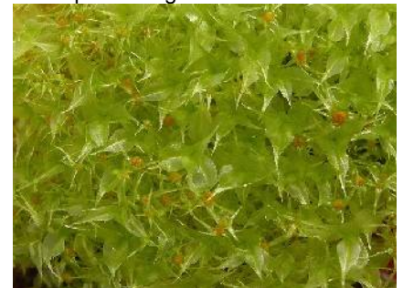
Splachnum ampullaceum (F. Séité)

En 2009, trois couples de courlis cendrés, deux de busards St-Martin, un de busards cendrés, trois d'engoulevents, un de rouge-queues à front blanc ont niché sur la réserve. La présence du muscardin, le rat d'or, est confirmée grâce à des noisettes grignotées. Un nouveau mammifère, le campagnol amphibie, a été recensé sur la réserve, le long du Squiriou. Une campagne de piégeage des micromammifères est menée sur le site, en partenariat avec le Groupe Mammalogique Breton. Des suivis amphibiens et reptiles ont également été mis en place dans le cadre d'un contrat nature, un programme régional mené par Bretagne Vivante.